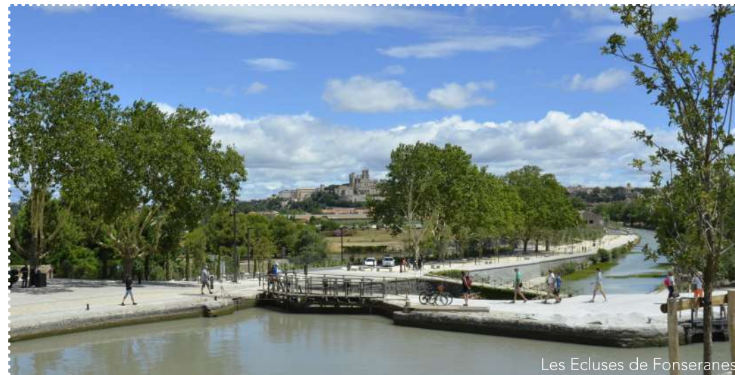
Les Ecluses de Fonseranes

De Narbonne à Sète, en passant par le Biterrois, l'itinéraire suit les berges des trois canaux : Robine, Jonction, Canal du Midi autrefois empruntées par les chevaux tractant la Barque de Poste. En suivant le canal du Midi, voie royale, chef d'œuvre du génie de Pierre-Paul Riquet inscrit au Patrimoine Mondial de l'Humanité par l'UNESCO, on remonte le temps : ouvrages d'art exceptionnels, cités millénaires, vignobles et étangs salés émaillent l'itinéraire pour le plus grand plaisir des baroudeurs qui retrouveront, au bout de cette étape en cours d'aménagement : les plages de la Grande Bleue.