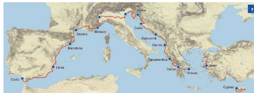
Carte de l'EuroVelo 8

C'est officiel, l'EuroVelo 8 se poursuivra à terme jusqu'en Turquie. L'itinéraire méditerranéen reliera Cadix en Espagne à Izmir en Turquie sur un linéaire de 7 500 km à travers 11 pays du bassin méditerranéen.