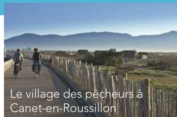
Le village des pêcheurs à Canet-en-Roussillon

Gares d'Argelès-sur-Mer, Perpignan, Rivesaltes, Leucate – La Franqui, Port La Nouvelle (grandes lignes), Narbonne.