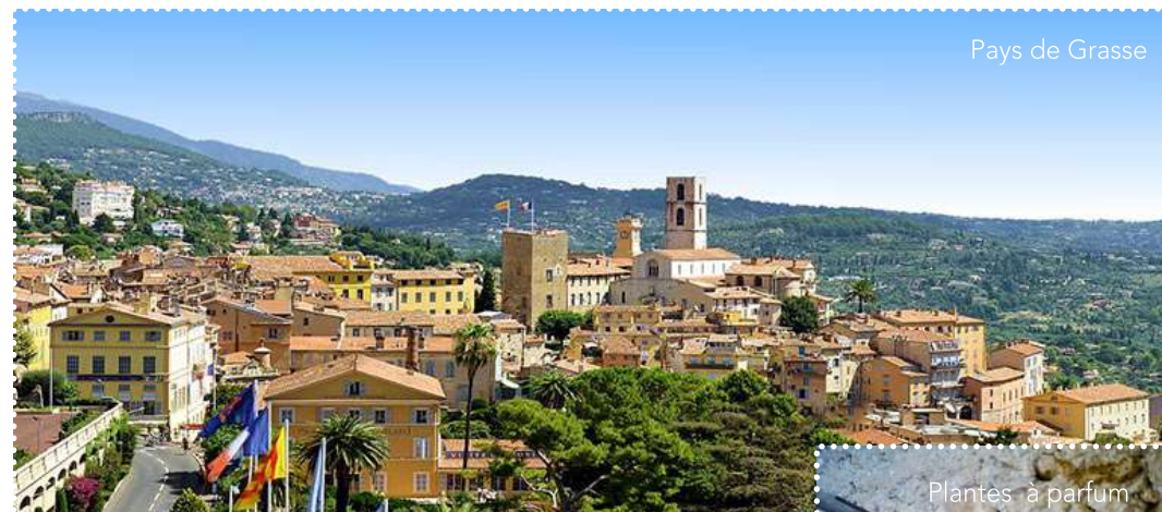
Pays de Grasse

Depuis Draguignan, la véloroute se connecte au village et à la gare des Arcs-sur-Argens via La Vigne à Vélo . Puis elle rejoint Figanières, Callas, Bargemon et Claviers par un itinéraire provisoire. Le parcours traverse ensuite les villages perchés du Pays de Fayence : Seillans, Fayence, Tournettes, Callian et Montauroux en suivant l'ancien tracé du Train des Pignes avant d'enjamber la Siagne, limite naturelle du Var et des Alpes-Maritimes. Entre Le Tignet et la Roquette-sur-Siagne, l'itinéraire traverse les villages du Pays Grassois : Peymeinade, Auribeau-sur-Siagne et Pégomas. En suivant la route des Balcons d'Azur, depuis Peymeinade, il faut 10 km pour rejoindre Grasse, capitale mondiale du parfum. A Mandelieu, l'itinéraire retrouve le bord de mer en direction de Cannes.