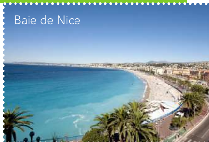
Baie de Nice

Gares de Cannes Golfe Juan, Juan-les-Pins, Antibes, Biot, Villeneuve-Loubet, Cagnes-sur-mer, St-Laurent-du-Var, Nice, Villefranche-sur-Mer, Beaulieu-sur-Mer, Eze, Cap-d'Ail, Monaco, Roquebrune-Cap-Martin, Menton (lignes TER).