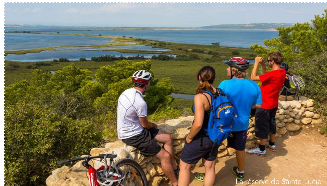
La réserve de Sainte-Lucie

Retrouvez les établissements Accueil Vélo sur www.lamediterraneeavelo.com