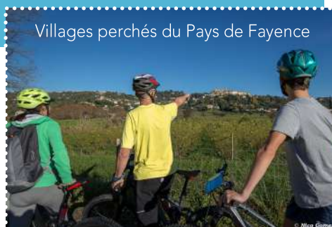
Villages perchés du Pays de Fayence