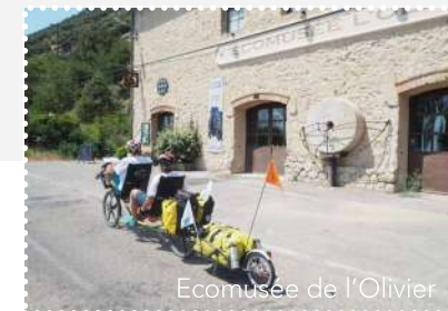
Ecomusée de l'Olivier