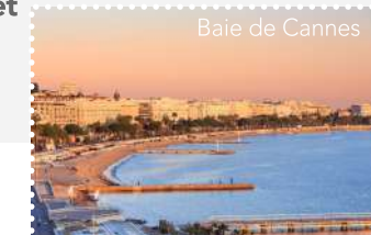
Baie de Cannes

Retrouvez les établissements Accueil Vélo sur www.lamediterraneeavelo.com