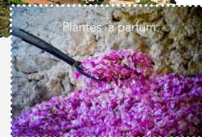
Plantes à parfum