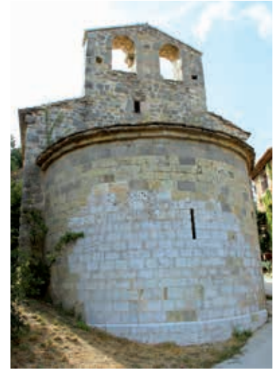
La chapelle ND de Bethléem

Suite aux crises liées aux épidémies et aux guerres, le village se dépeuple, pour se reconstituer au XVI e siècle en contrebas de l'agglomération primitive. Il s'étendra le long des axes de communication principaux entre le XVI e et le XVIII e siècle. La commune compte aujourd'hui plus de 2700 habitants.