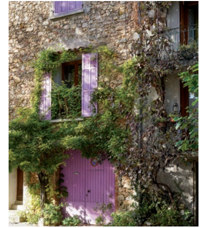
Façade du village