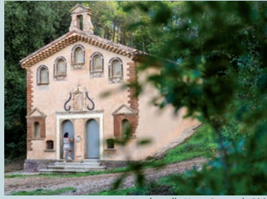
La chapelle Notre Dame de Pitié