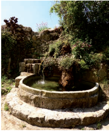
La fontaine aqueduc