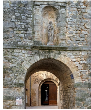
Détail de la Tour de l'Horloge