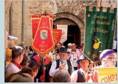
La Foire à la saucisse