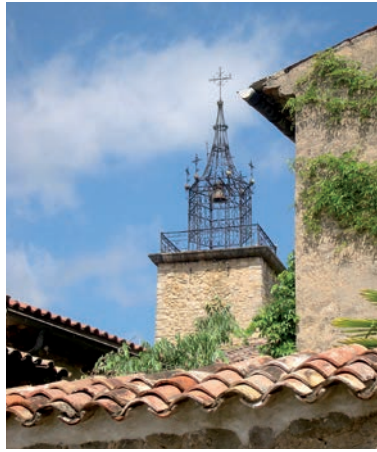
Le campanile de l'église