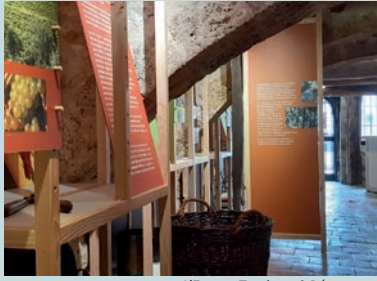
L'Espace Tourisme & Découverte