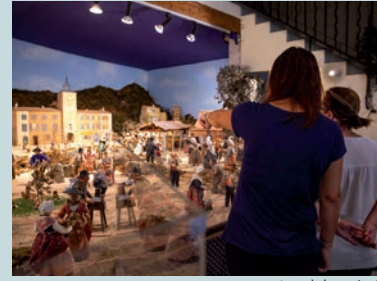
La crèche animée