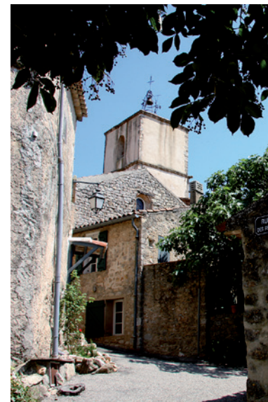
Vue du clocher

Découvrez l'histoire, le patrimoine et les curiosités de Fox-Amphoux en suivant le circuit proposé, composé de panneaux numérotés, ou en lisant ceux que vous croiserez au hasard des rues. Lors de votre balade, prenez le temps d'observer autour de vous les détails qui font la richesse du patrimoine et n'hésitez pas à sortir de l'itinéraire balisé.