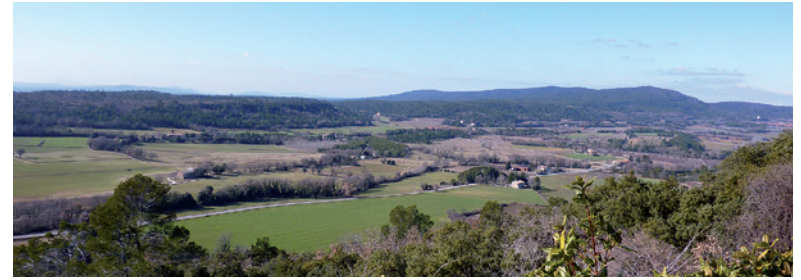
Vue de la plaine de Fox