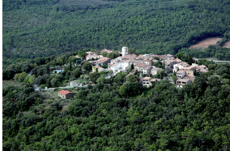
Vue du village