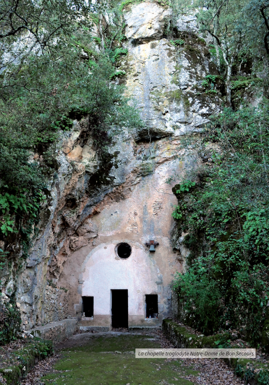
La chapelle troglodyte Notre-Dame de Bon Secours