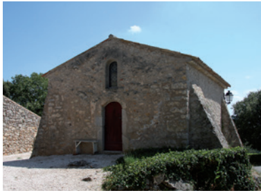
Chapelle des Pénitents