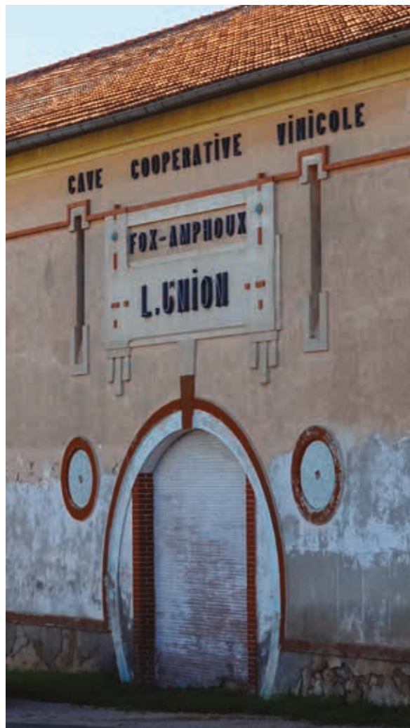
L'Union, cave coopérative vinicole de Fox-Amphoux, 2013.

A Fox-Amphoux, la coopérative L'Union est bâtie en 1912 : elle fait partie des 25 premières coopératives du département. Elle subit par la suite de nombreux agrandissements entre 1942, où le bâtiment d'origine est prolongé, et 1980, où la grande cuve métallique extérieure est installée.