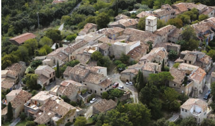
Fox-Amphoux en 2013.

La Communauté de communes Provence Verdon et le Pays d'art et d'histoire de la Provence Verte vous souhaitent la bienvenue à Fox-Amphoux. Ils se proposent de vous accompagner au cours de votre visite et vous invitent à prendre le temps de découvrir son histoire et son patrimoine.