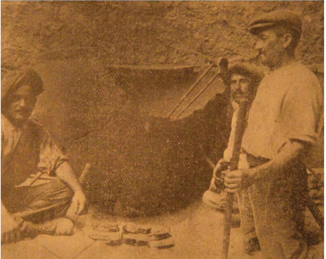
Découverte d'un dolium * en 1920 dans un champ, à Fox-Amphoux.

* dolium : un vase de très grande taille de l'Italie antique, d'une contenance pouvant aller jusqu'à 1 200 litres (voire 2 500), et qui servait de citerne à vin, à huile ou à céréales.