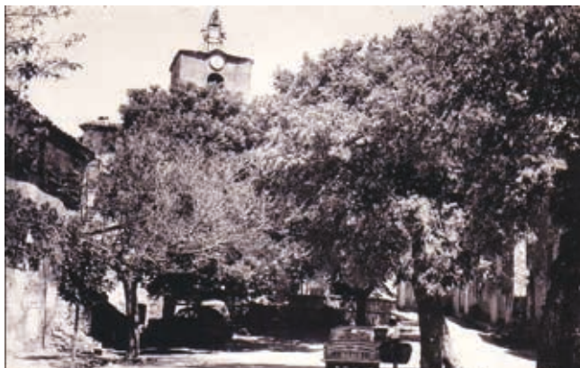
Le Vieux Fox, carte postale, 1966.

A cette époque, l'élevage du ver à soie était une activité économique importante en Provence. Tous les chemins et la plupart des routes étaient bordés de mûriers dont les feuilles nourrissaient les vers à soie. En 1888, il y avait 625 mûriers plantés à Fox et une cinquantaine d'éleveurs. Il s'agissait là d'une économie de complément non négligeable. Dans les bastides les plus importantes la magnanerie était un bâtiment isolé comprenant un rez-de-chaussée et un étage. Mais souvent, la maison des ménagers faisait office de magnanerie. La famille allait alors dormir dans la grange ou au grenier de manière à laisser la place aux vers à soie pendant les cinq à six semaines que durait l'éclosion.