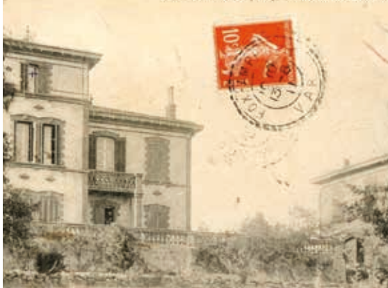
Une des bastides de Fox-Amphoux : Le Château du Grand Pouvet, Carte postale.

En 1714, le clocher est réparé, le campanile posé et une cloche est refondue. Sur celle-ci figure l'inscription suivante : « Pour la plus grande gloire de Dieu et de la vierge Marie, je suis la dispensatrice de leur allégresse. » La deuxième cloche, fondue en 1726, est dédiée à la Vierge et au saint patron de la paroisse : « Que Sainte Marie et le Bienheureux Blaise intercèdent pour nous auprès du seigneur pour que nous méritions d'être appelés aux biens célestes. Huard m'a fait. ». A cette époque, fondeur de cloches est un métier ambulancier : les cloches étaient coulées sur place, le bronze étant fourni par la commune. Joseph Huard, venu de Clérieux dans le Dauphiné, fait partie des fondeurs de cloches itinérants qui parcouraient la campagne à la recherche de commandes.