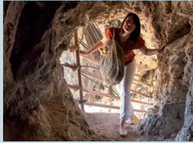
Visite du rocher