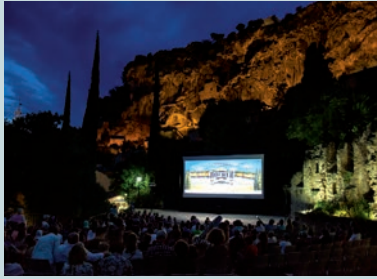
Festival des Toiles du Sud