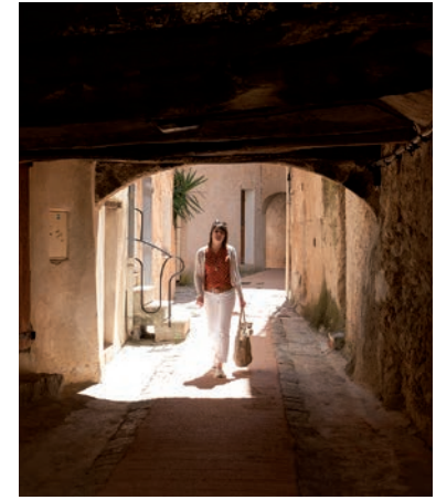
Ruelle avec passage couvert