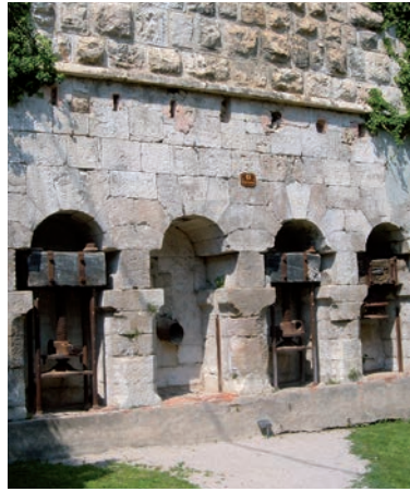
Ancien pressoir à huile