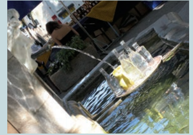
Fontaine Cours Gambetta