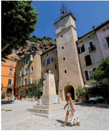
Place de la Mairie