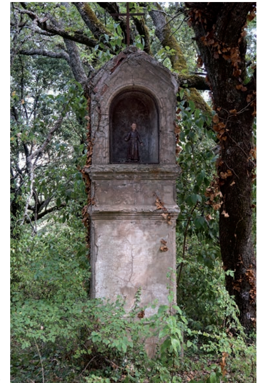
Oratoire Saint-Pierre et Saint-Roch, abords de la route de Pourrières

Probablement érigé à la fin du 19 e siècle, l'oratoire Saint-Pierre et Saint-Roch, à deux niches, est localisé aux abords de la route de Pourrières, à la sortie sud du village. Son vocable Saint-Pierre évoque l'appellation du proche château d'Artigues encore présent au 18 e siècle.