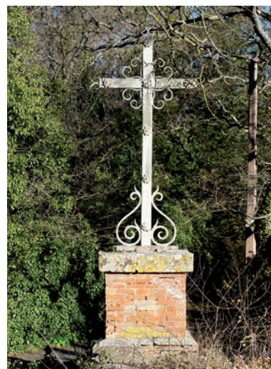
Croix de chemin, est du village

Une autre croix, se trouvant aux abords de la route départementale, est probablement également réalisée dans la première moitié du 20 e siècle après l'aménagement du chemin départemental d'Artigues. Elle marque ainsi l'accès au village par l'ouest.