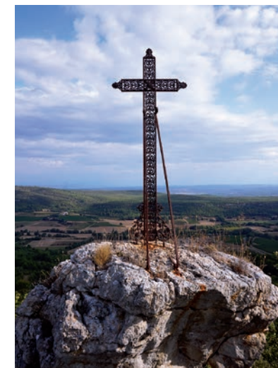
Croix monumentale dite croix d'Artigues, chemin de crête de la montagne d'Artigues

Cette croix monumentale, connue comme la croix d'Artigues, semble être dressée au 19 e siècle. Fixée directement dans le rocher, elle domine la falaise bordant le chemin de crête de la montagne d'Artigues.