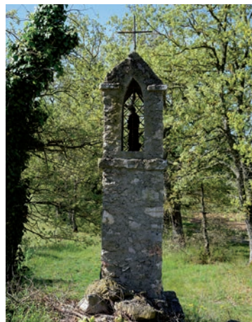
Oratoire Saint-Benoît-Joseph-Labre, hameau des Bellon