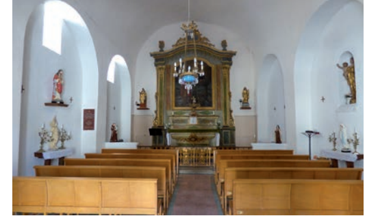
Intérieur de l'église vu depuis la nef