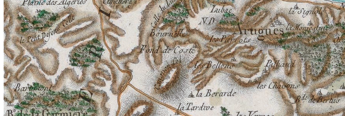
Artigues sur la carte de France dite carte de Cassini, 3 e quart du 18 e siècle | Bibliothèque nationale de France