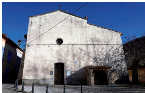
Église paroissiale Sainte-Foy vue depuis l'ouest