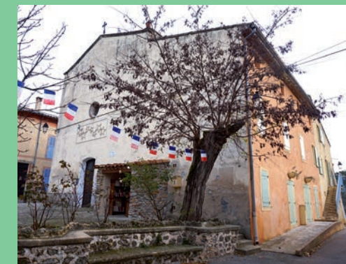
Église paroissiale Sainte-Foy vue depuis le sud-ouest

Débutée par les Esparronnais, la procession du mois de mai à la chapelle Notre-Dame-de-Sainte-Foy se poursuit cent ans plus tard à l'église paroissiale Sainte-Foy. Les Artiguis la perpétuent ensuite aux côtés de la fête patronale de Sainte-Foy célébrée en octobre depuis au moins le 18 e siècle.