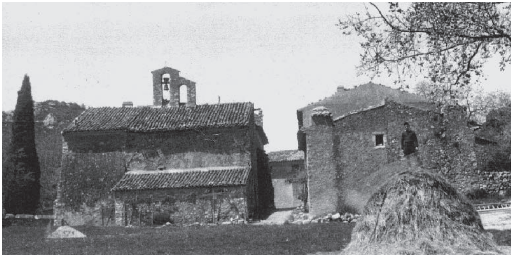
Église paroissiale Sainte-Foy et son clocher vus depuis l'est, 1 ère moitié du 20 e siècle