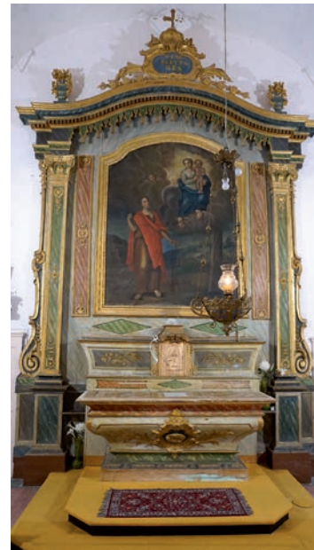
Ensemble du maître-autel de sainte Foy