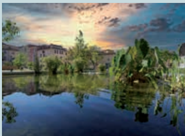
Jardin Charles Gaou