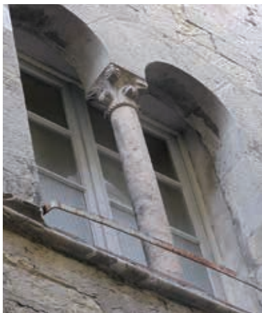
Fenêtres à menaux - vieille ville