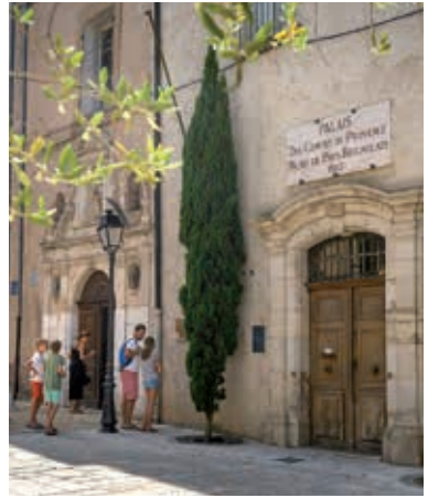
Place des Contes de Provence

Following the political instability and insecurity of the early Middle Ages, in the 11 th century a first castrum of around two hectares, surrounded by a rampart, was established on the site of the present-day Saint-Sauveur church. From the year 1222, the town grew in importance as the Consulate of Brignoles came under the control of the Counts of Provence. The fortified village expanded and a second wall was built. In 1481, when Provence became part of the kingdom of France, Brignoles became the capital of a viguerie (an administrative subdivision of the kingdom). At the end of the 16 th century, the Duke of Épernon was appointed Governor of Provence and established his headquarters there, and the construction of a third rampart was undertaken (1578-1615). Urban spread then continued between these new ramparts and those of the 13 th century. After the French Revolution, Brignoles became the capital of the Var département from 1795 to 1800, and then a sub-prefecture. The town began to really thrive, with major roads built and a railway station