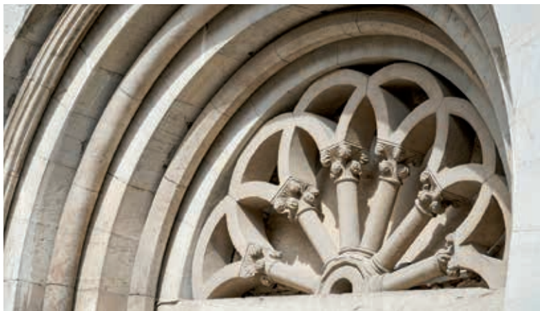
Fronton de l'église Saint-Sauveur