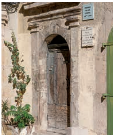
Premier palais comtal

house to use as the new town hall, where it still stands today.