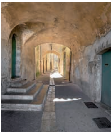
Ruelle avec passage couvert

À deux reprises, la place Saint-Pierre change de nom. En 1794, elle prend le nom de place Dampierre, puis en 1894, le nom du président assassiné Sadi Carnot, qu'elle conserve jusqu'en 1963.