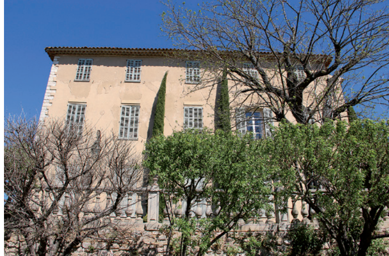
Château de Seillons