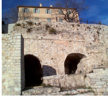
Ancien village médiéval