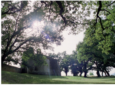
Chapelle Notre-Dame du Revest