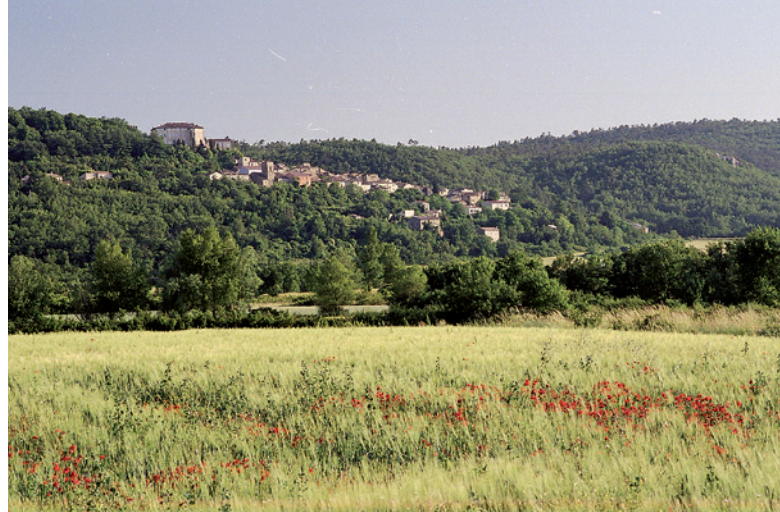
Vue du village