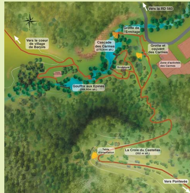
Conseil Général du Var - Atelier CEPAGE

Le Vallon des Carmes, propice aux balades et à la découverte de la nature est ouvert aux visiteurs toute l'année.