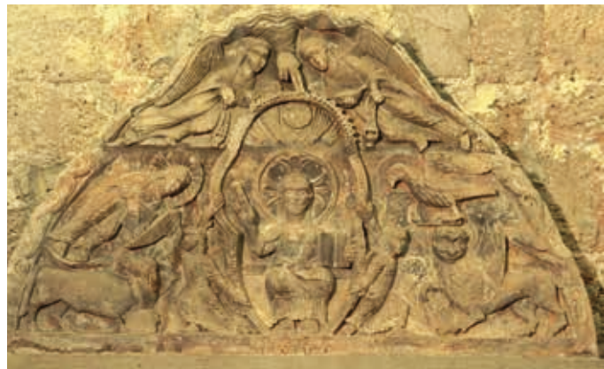
Le tympan de la collégiale.

desservir les églises alentour se fait sentir. C'est pour y pallier que s'établit ici, vers 1060, un « collège » de clercs : des chanoines* placés sous l'autorité d'un prepositus (prévôt). Ils mènent une vie commune organisée autour d'un cloître (clastre) et célèbrent ensemble l'office divin. Mais, à la différence des moines, ils ont en charge des églises proches. Pour subvenir à leurs besoins, les biens et revenus de la collégiale sont répartis entre eux. Le système se maintient jusqu'à la Révolution en se sécularisant progressivement. Peu à peu, la vie commune est abandonnée et les biens sont affectés à chaque chanoine (prébende). En 1790, le chapitre* est composé de dix chanoines, dont le prévôt, l'économe et le capiscol*, et de dix bénéficiers*.