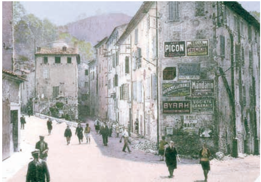
Le Bourg Neuf, sortie d'usine.