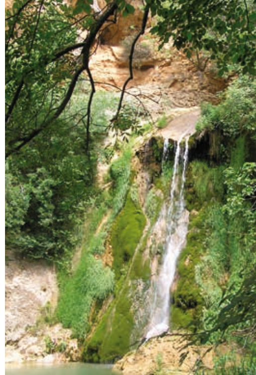
Le vallon des Carmes.

Le site de Barjols est tout d'abord occupé successivement par les Ligures et les Romains. Au début du XI e siècle, le bourg, qui s'est développé autour de son église, dépend du castrum de Pontevès. Au XIV e siècle, Barjols devient une des résidences des comtes de Provence. Jusqu'au XVI e siècle, le village subit les ravages de la peste et des guerres de Religion. S'en suit une période prospère durant laquelle l'industrie du travail des peaux se développe et fait de Barjols une véritable «petite capitale française du cuir». Les tanneries connaissent leur apogée dans les années 1950 avant de fermer au début des années 1980. En subsiste aujourd'hui un riche patrimoine industriel.