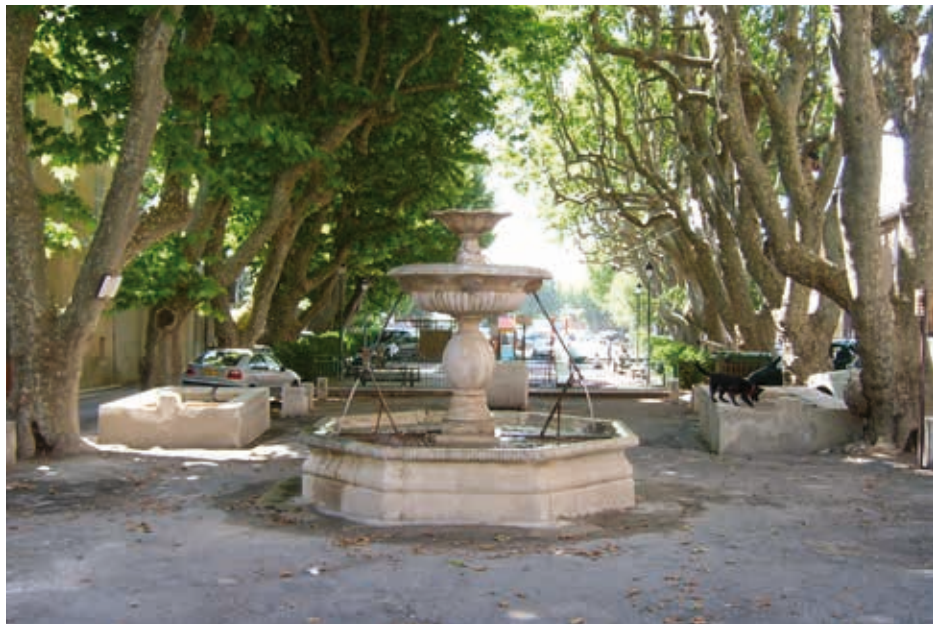
La fontaine du Boeuf et ses lavoirs.