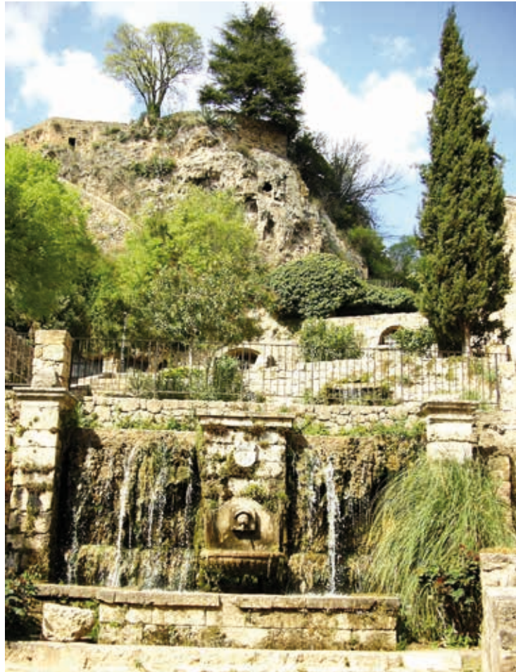
Les ruines de l'ancien château sur les hauteurs du Réal.