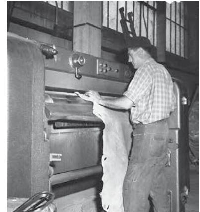
Tanneur barjolais aux machines.

Puis l'arrivée du tannage par des sels de chrome, apparu vers 1920 et généralisé après 1945, réduit le temps de tannage à vingt-quatre heures. Ce nouveau système développa fortement la concurrence.