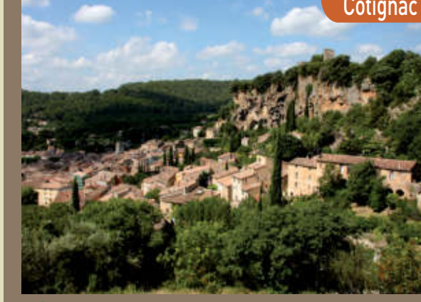
13 Le Sanctuaire Notre Dame de Grâces Cotignac 04 94 69 64 90 - nd-de-graces.com