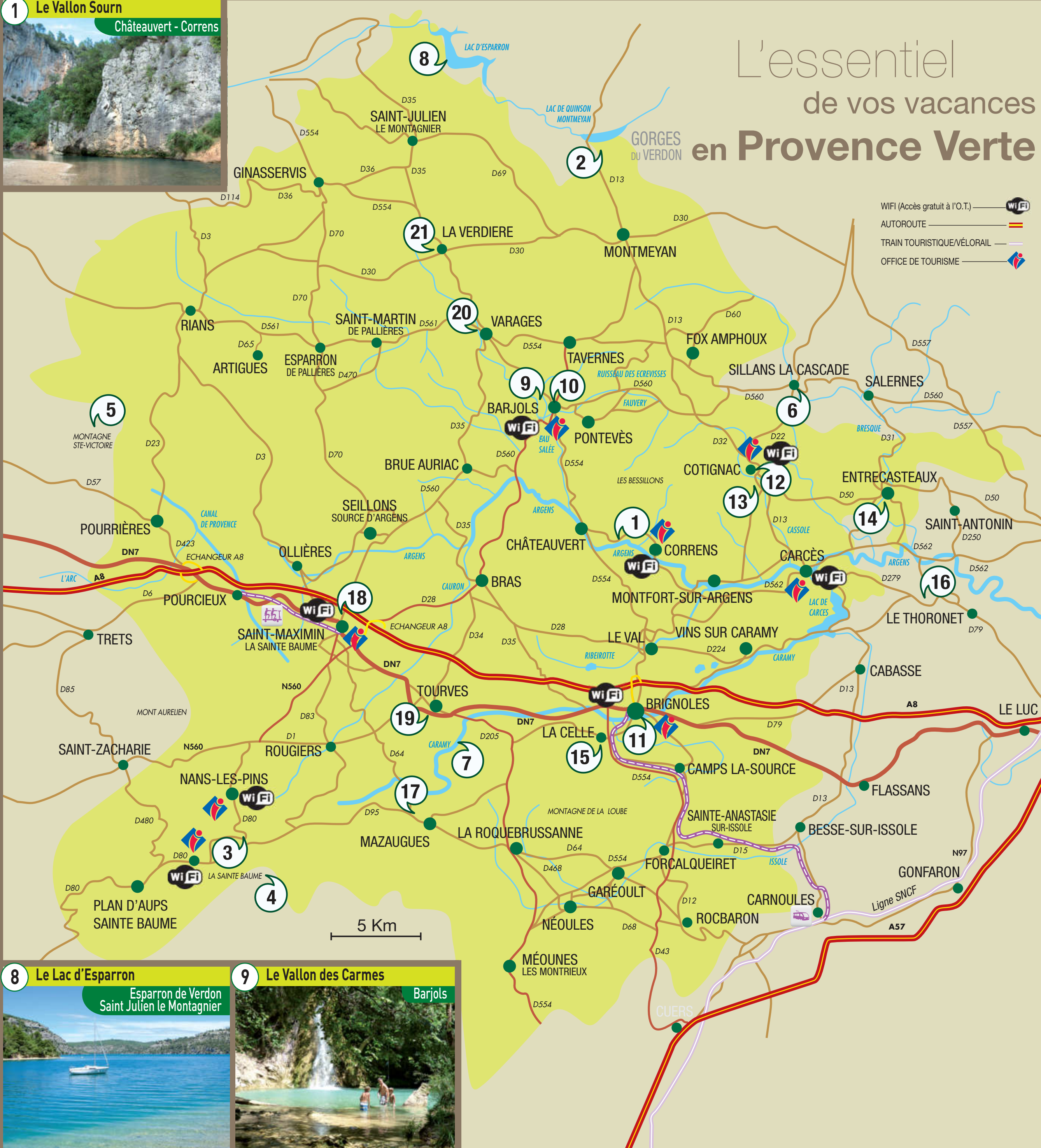
2 Les gorges du Verdon Montmeyan