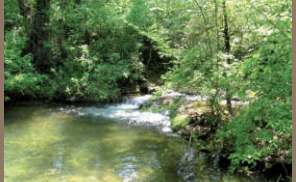
8 Le Lac d'Esparron Esparron de Verdon Saint Julien le Montagnier