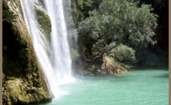
7 Les Gorges du Caramy Tourves