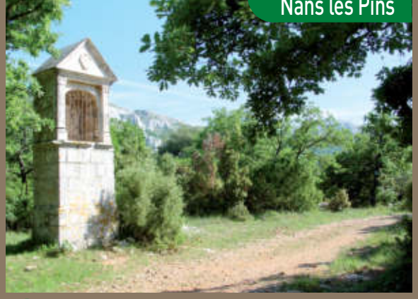
4 Le Massif de la Sainte Baume et grotte de Marie-Madeleine Plan d'Aups Sainte Baume