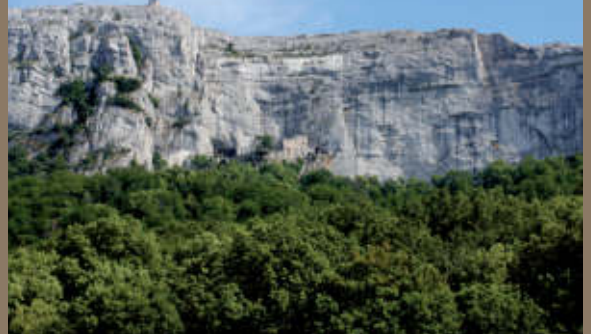
5 La Montagne de la Sainte Victoire Pourrières